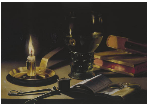
Nature morte avec la chandelle brûlante, Pieter Claesz, 1627