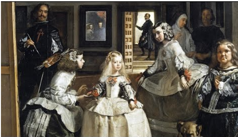
Les Ménines , Diego Vélasquez, 1656