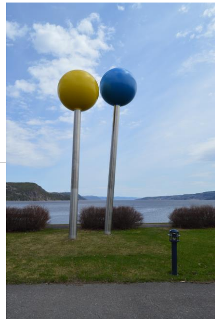
La croisée des chemins , 2016 Acier inoxydable, métal 772 x 411 x 300 cm