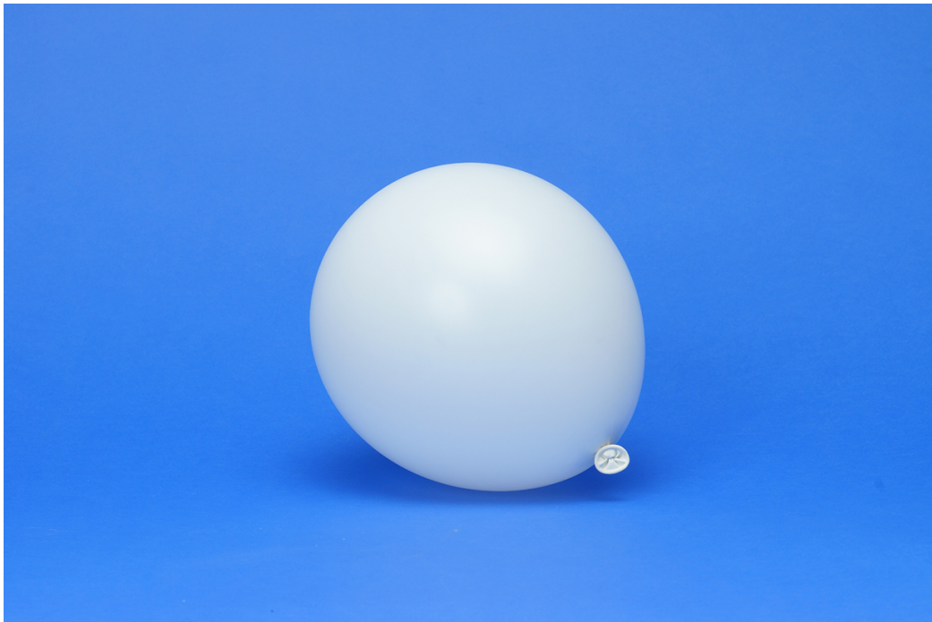
Sels de bain , Stéfanie Requin Tremblay, 2015

Est-ce que les textes proposés par Stéfanie Requin Tremblay auraient la même signification s'ils n'étaient pas présentés avec ces images ? Est-ce que ses collages auraient la même portée évocatrice ? Semblables à la poésie, est-ce que les œuvres de l'artiste suscitent en vous des émotions et des sensations ? Si oui, lesquelles et pourquoi ?