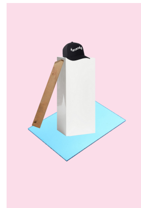
Hygiène III, Stéfanie Requin Tremblay, 2018