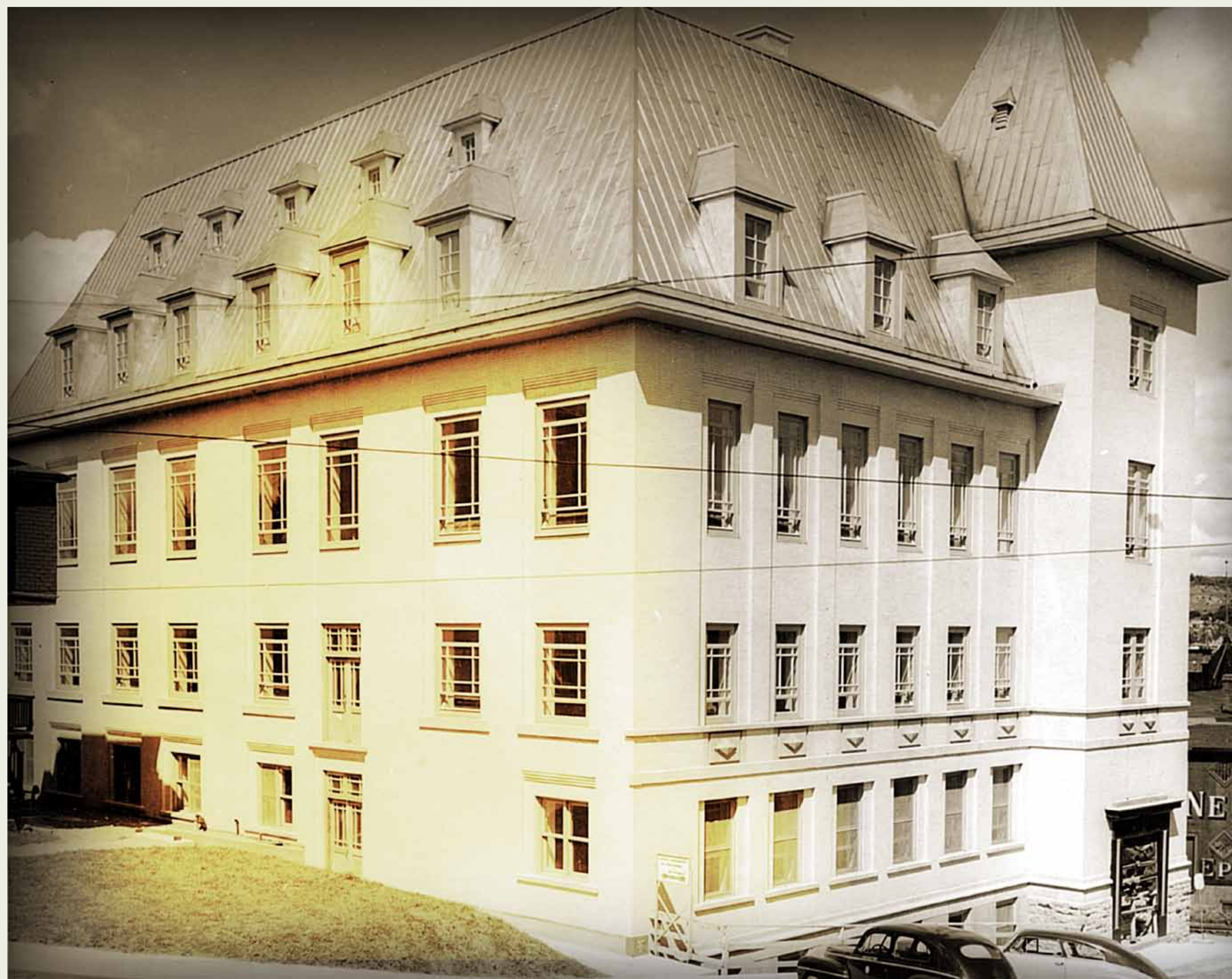
BAnQC, SHS, P2, 01331

THE « SAGUENAY-QUÉBEC TÉLÉPHONE » BUILDING