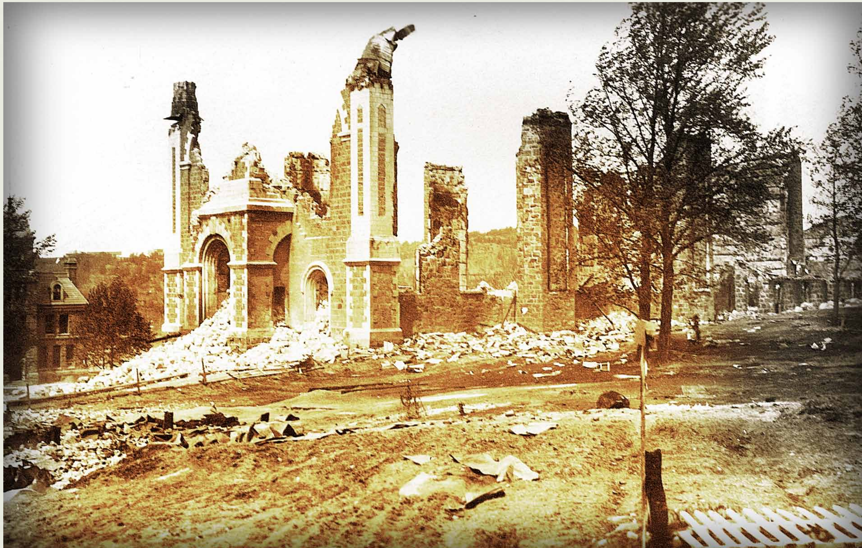
BAnQC, SHS, P2, 00621