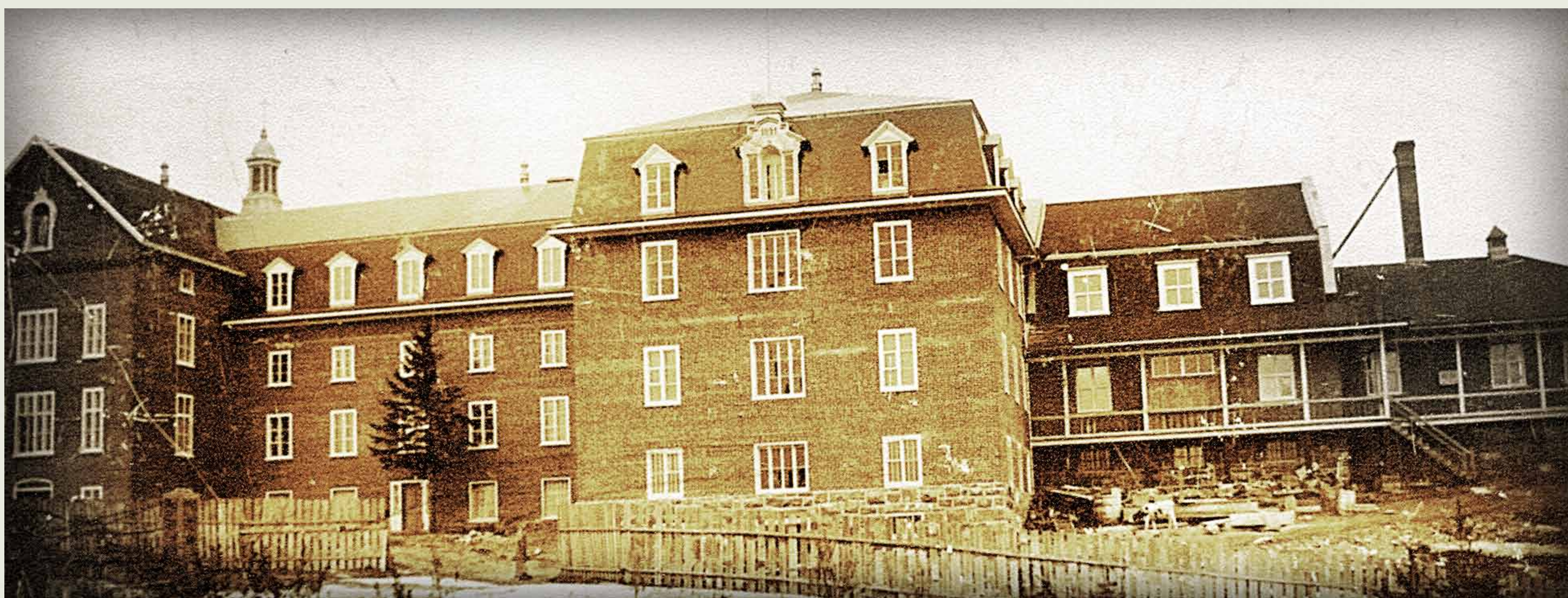
BAnQC, SHS, P2, 09611