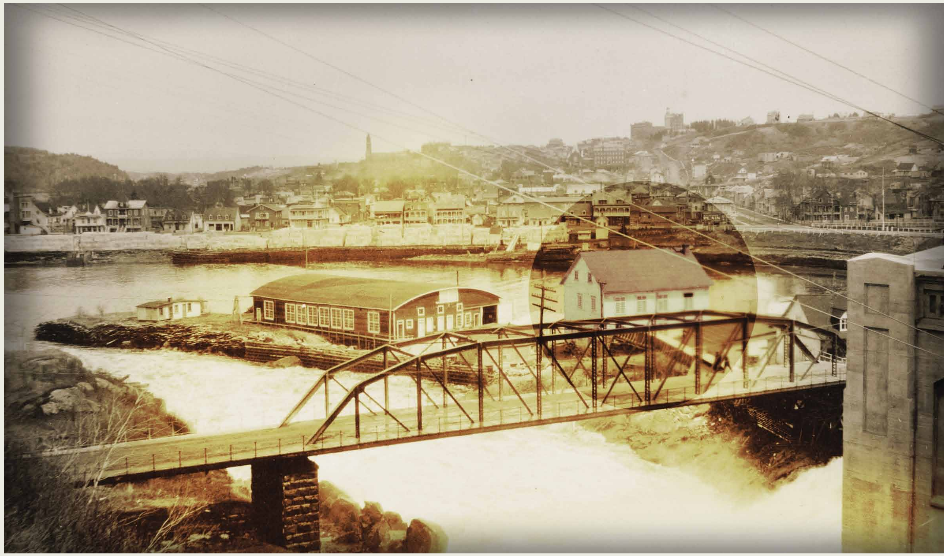
BAnQC, P666, S12, D5, P333

Vers 1925, un hangar pour hydravion voisinait le moulin qui apparaît dans le cercle