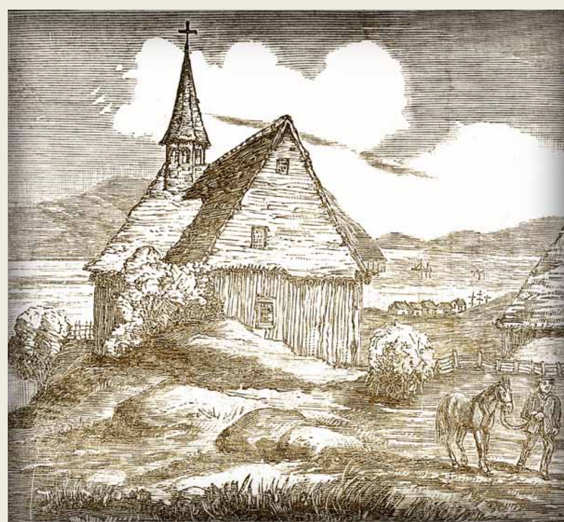
BAnQC, SHS, P2, S7, P00967