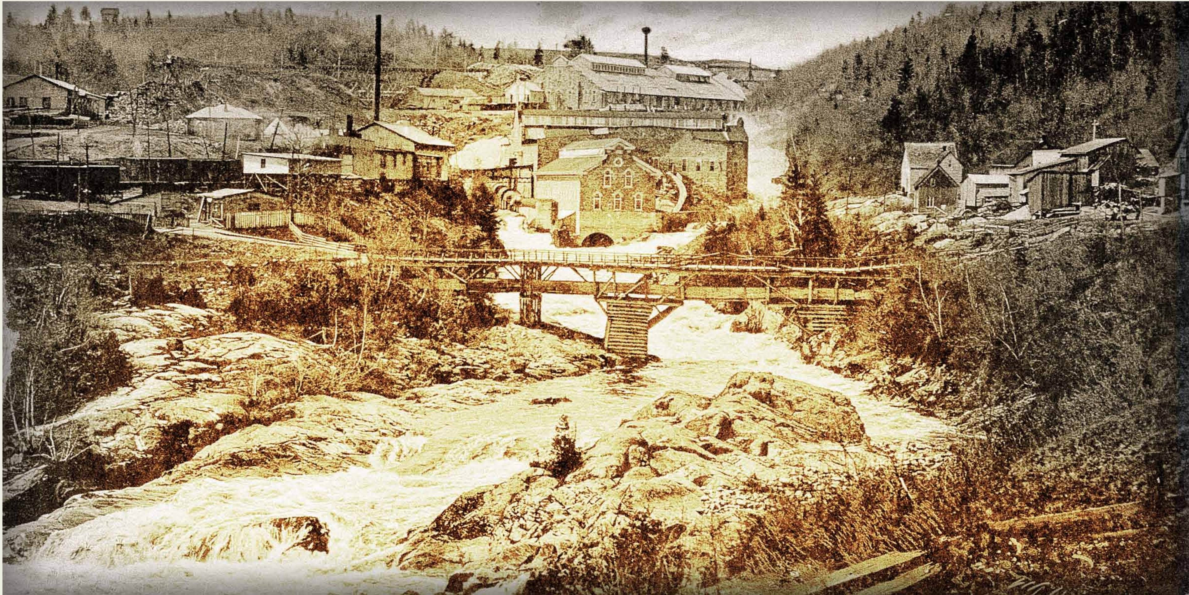
BAnQC, SHS, P206026