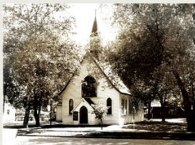
Ancienne église St. James the Apostle / Former St. James the Apostle Church

THE CENTRE D'HISTOIRE SIR-WILLIAM-PRICE (FORMER ST. JAMES THE APOSTLE CHURCH)