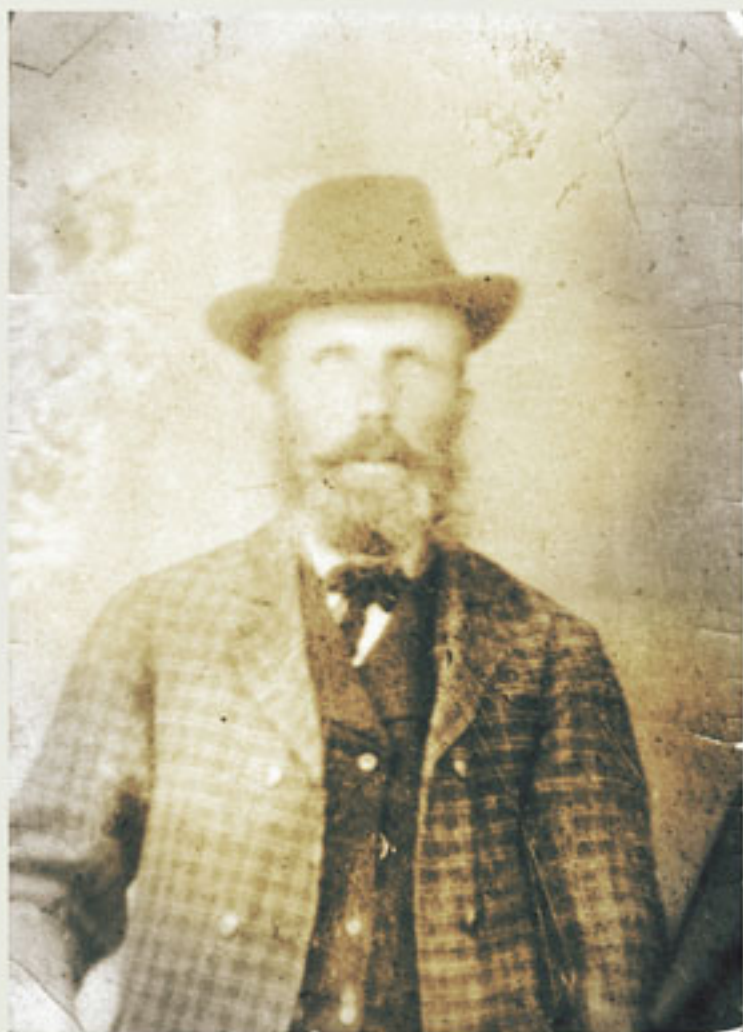
Jean Allard BAnQC-SHS-P2-S7-P02168