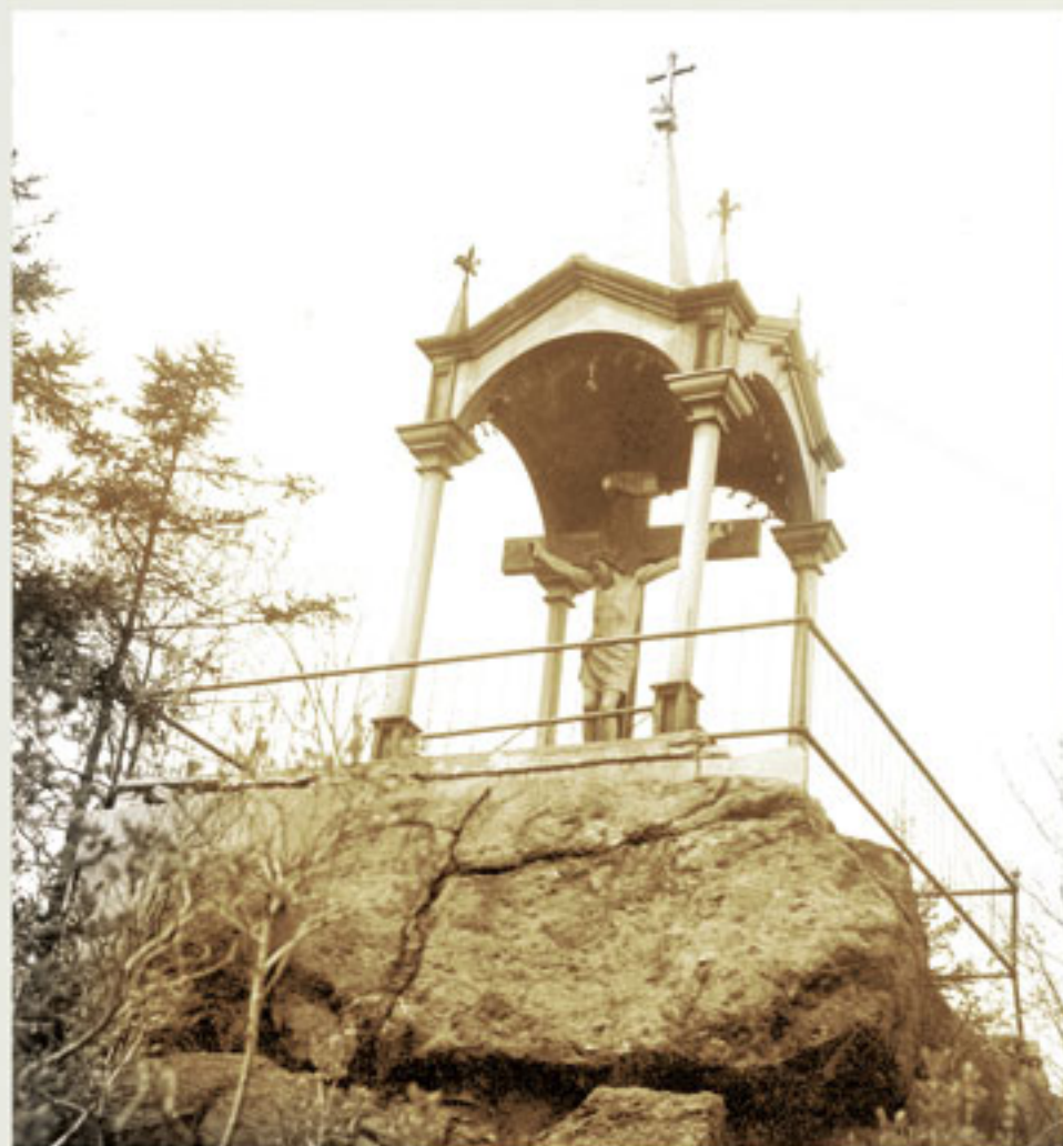
Le calvaire sur le Cran Ouellet. / The cross on the Cran Ouellet.

Antérieurement connu sous le nom de cran Ouellet, c'est en 1988 que ce site est désigné en l'honneur du premier maire de Jonquière. Cultivateur et menuisier, Jean Allard était aussi un administrateur respecté qui a été élu maire à trois reprises (1866-1868, 1872-1876 et 1894-1895). En 1907, la population de la municipalité profitait d'un système d'aqueduc dont le réservoir central était situé sur cette élévation. Plus tard, en 1910, on y érigea un calvaire (croix en plein air qui commémore la passion du Christ). Aujourd'hui, ce parc vous permet de profiter d'une vue magnifique.