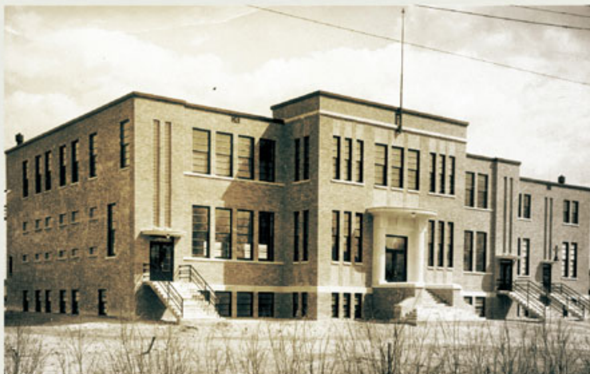
Le Patro de Jonquière, début des années 1950. / The Patro de Jonquière, (Recreation Centre), early 1950s. BAnQC-SHS-P2-S7-P08182

Les activités du Patronage Saint-Vincent-de-Paul de Jonquière ont débuté en 1947 dans la Salle publique. En 1949, on entreprend la construction d'un édifice plus fonctionnel, conçu par les architectes Lamontagne et Gravel, pour mieux répondre aux besoins de loisirs des jeunes. Inauguré en 1950, l'édifice de brique est très sobre, à l'image des Frères Saint-Vincent-de-Paul. En 1997, l'entrée principale est agrandie pour permettre l'insertion d'un ascenseur; l'esprit Art déco du portail d'origine y a été préservé. L'édifice a conservé sa vocation d'origine de centre d'entraide et de loisirs pour les jeunes.