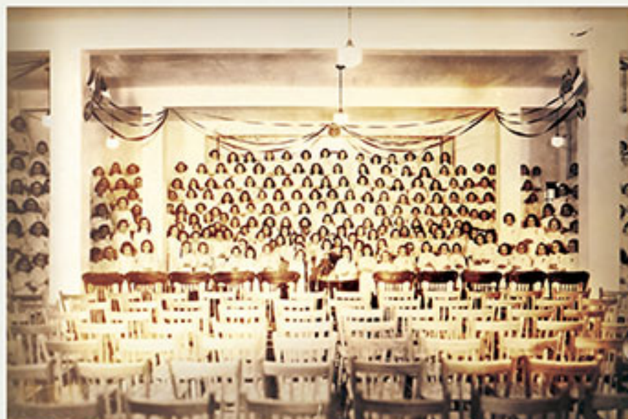
Première réception au pensionnat, 12 novembre 1939/ Opening day at the residential school on November 12, 1939