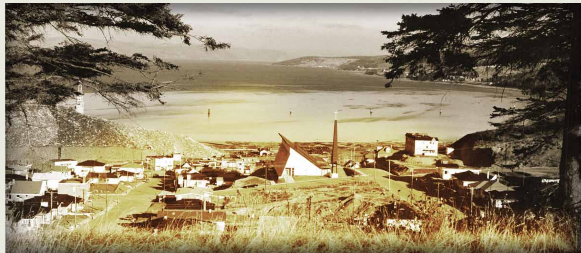
Vue de l'église Notre-Dame-de-La-Baie, 1970c

Notre-Dame-de-La-Baie church view, circa 1970