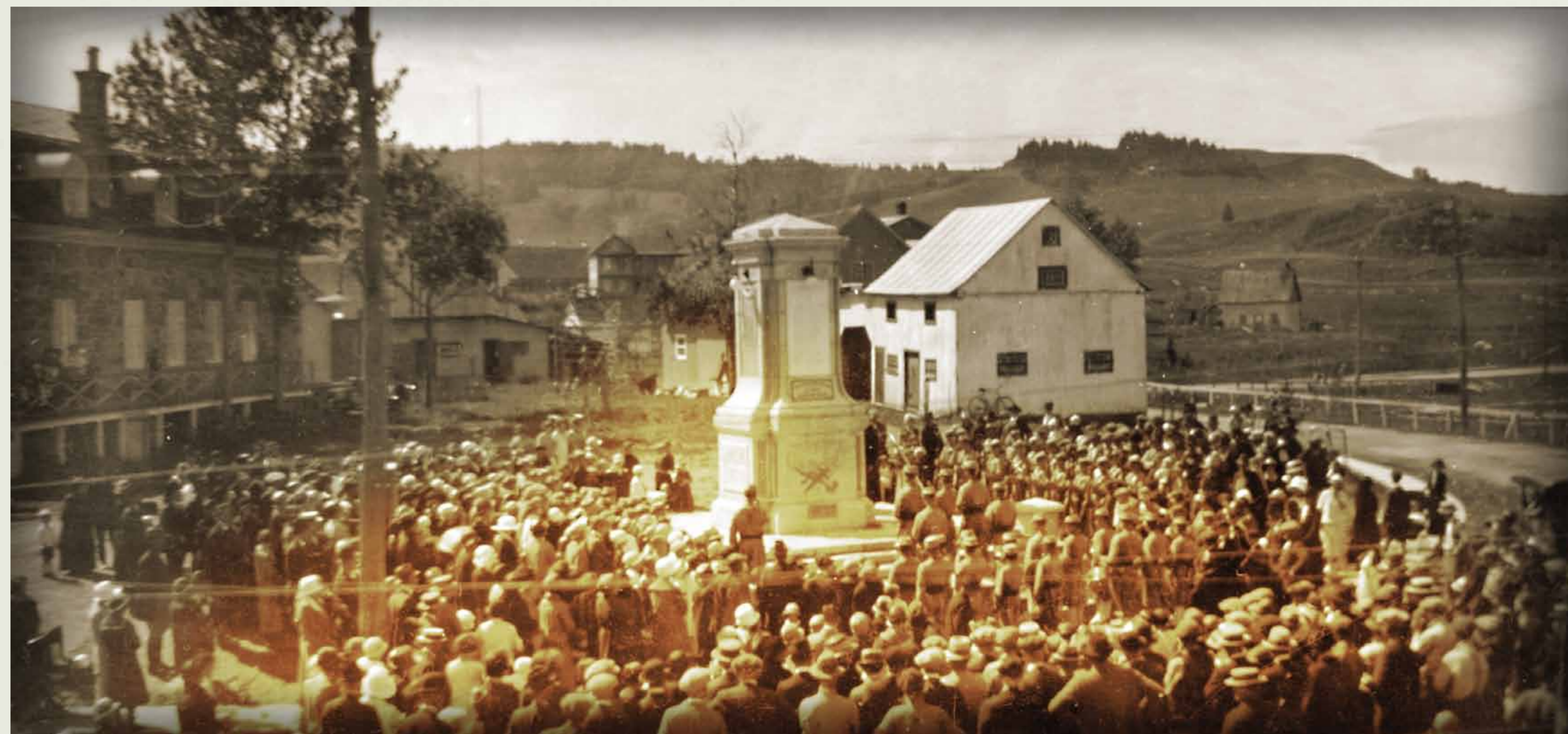
BAnQC, SHS, P2, S7,12.3-p059