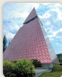
INTERPRETATIVE HERITAGE SIGN