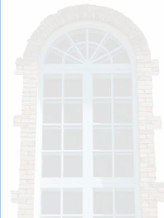
En couverture : Détail de l'architecture de l'Hôtel de ville de Port-Alfred (voir no 16).

Itinéraire d'une mémoire, Répertoire des œuvres d'art publiques au Saguenay-Lac-Saint-Jean . Saguenay, Séquence - Arts Visuels et Médiatiques, 2005. 219 p.