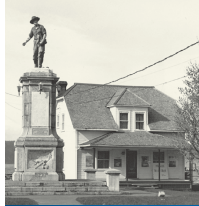
Monument des 21 devant le Musée Mgr Dufour (Musée du Fjord)