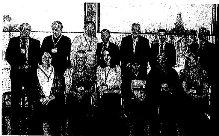
Accueil de nouvelles familles par le SIA

Au chapitre de la création d'entreprises, deux projets sont en cours de réalisation et d'autres sont en phase d'analyse. Des projets de relève d'entreprises sont à l'étude et d'autres sont à prévoir.