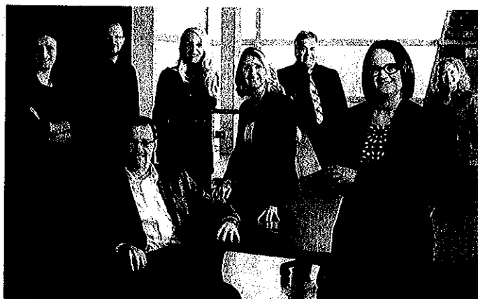
L'équipe du Service aux entreprises

Que les entrepreneurs en soient à leurs premières démarches dans le monde des affaires ou qu'ils soient plus aguerris, ils peuvent compter sur l'aide de Promotion Saguenay pour réaliser leurs projets.