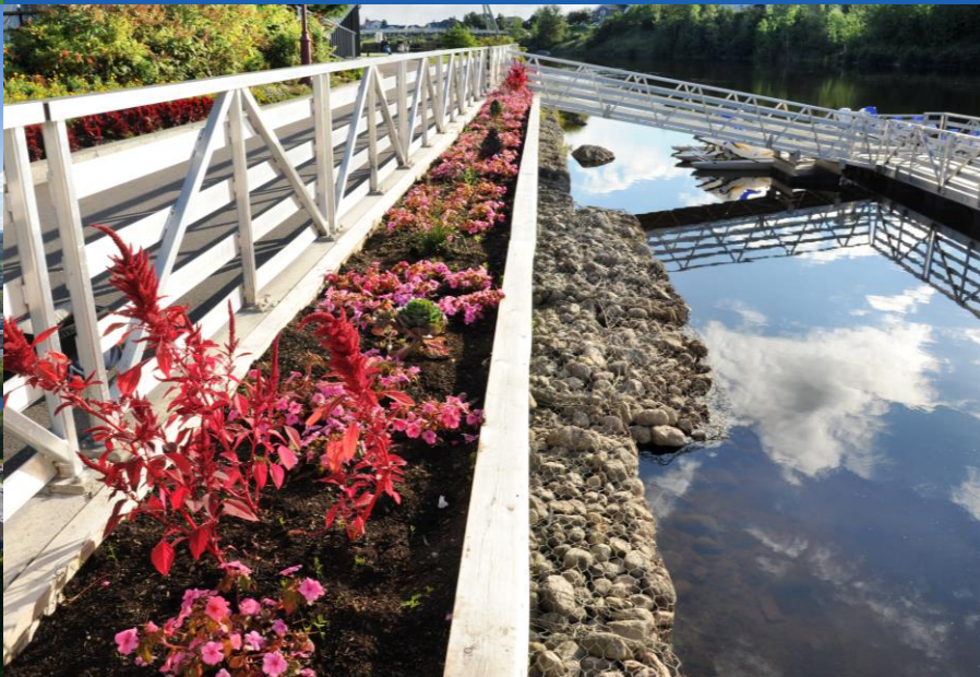
Parc de la Rivière-aux-Sables, Jonquière