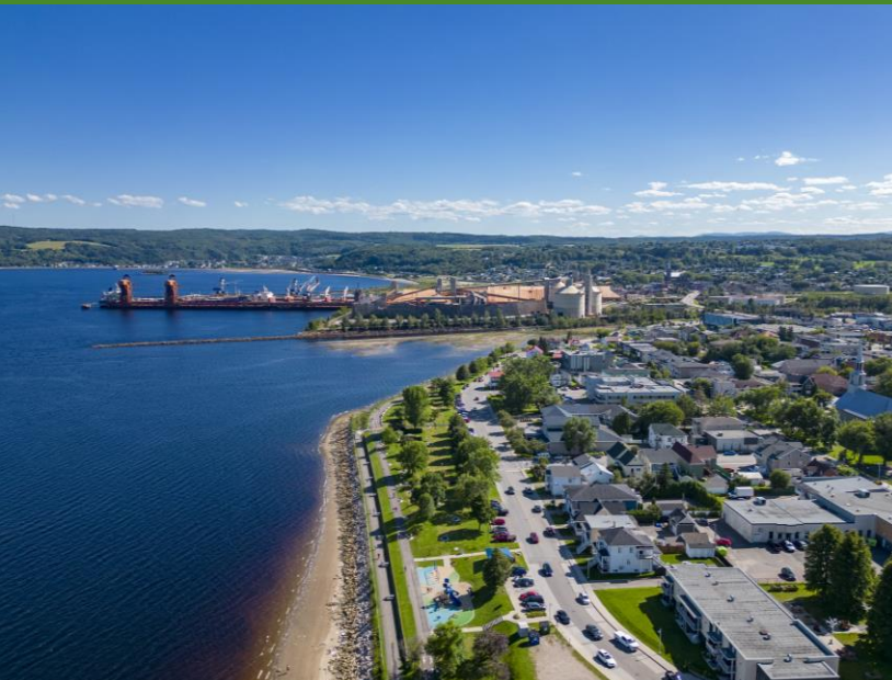
Parc de la Consol, La Baie