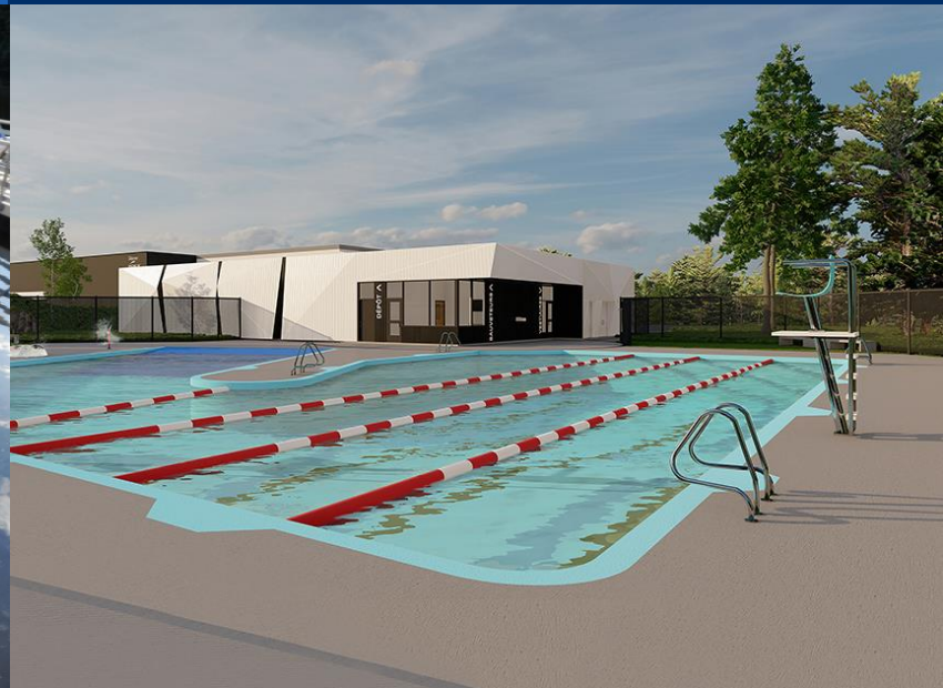
Piscine du parc de la Colline, Chicoutimi