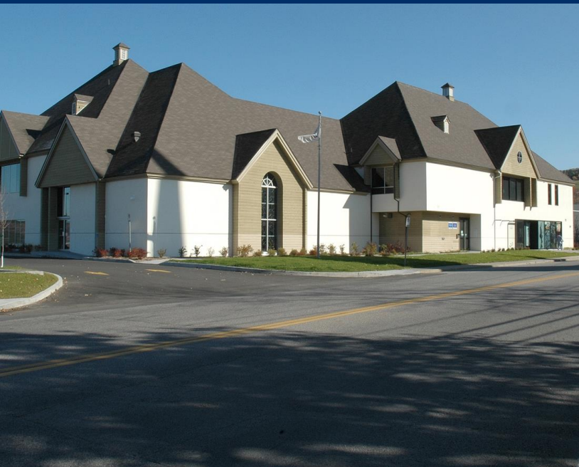
Musée du Fjord, La Baie